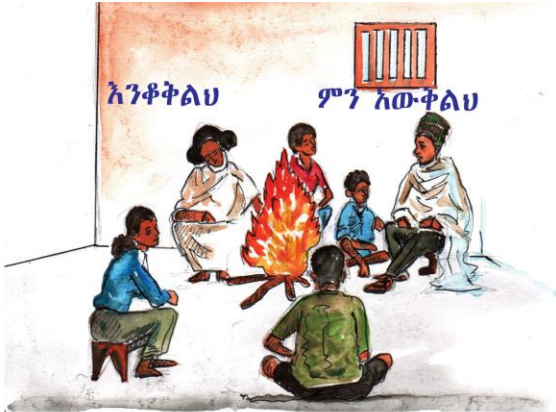
1. አፍዋን ክፍታ ሰውን የምታይ= እንስራ

መምህር ከዚህ በታች በስእል ተደግፎ የቀረበውን እንቆቅልሽ ተማሪዎችዎን በመጠየቅ አጫውቷቸው። ተማሪዎችም የሚያውቁቸውን ሎሎች እንቆቅልሾች በመጠየቅ እንዲጫወቱ ያድርጉ።